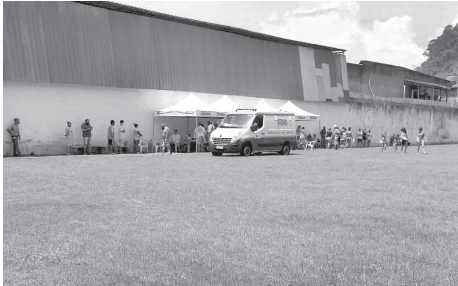
Testagem aconteceu no campo de futebol da lagoa na manhã desta quarta-feira (16)