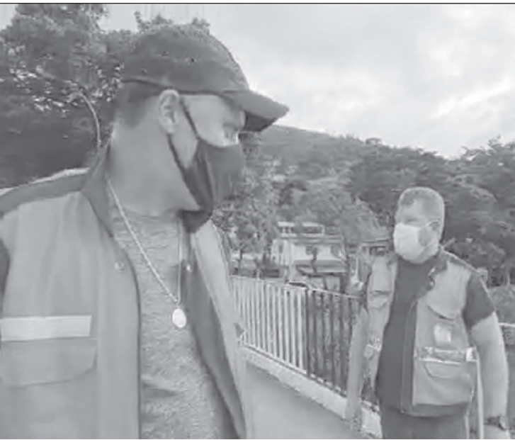
Equipe da Defesa Civil foi até Bananal e verificou que não houve transbordamento no rio