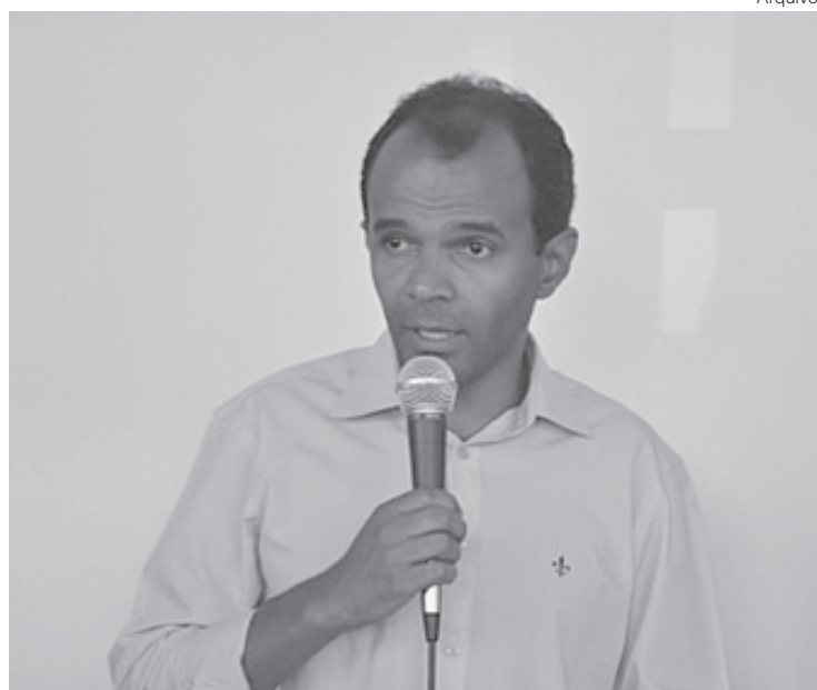
TSE indefere registro de Dudu, e Itaitiaia terá novas eleições se embargo não mudar decisão