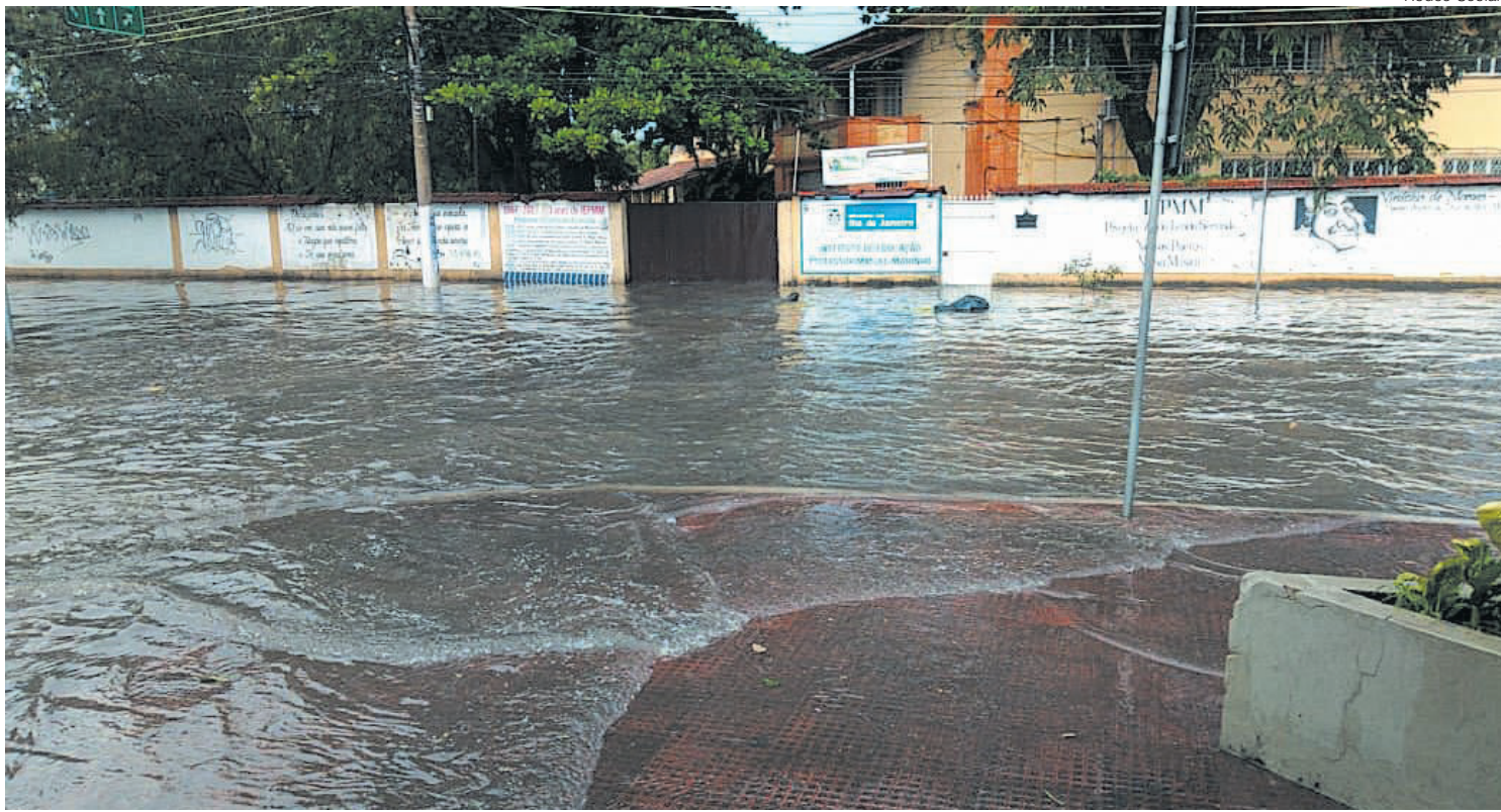
Rua perto do Colégio Manoel Marinho, na Vila Santa Cecília, ficou completamente alagada e se transformou em um rio

Ruas de pontos centrais e de bairros viraram um rio e Defesa Civil registrou 15 ocorrências