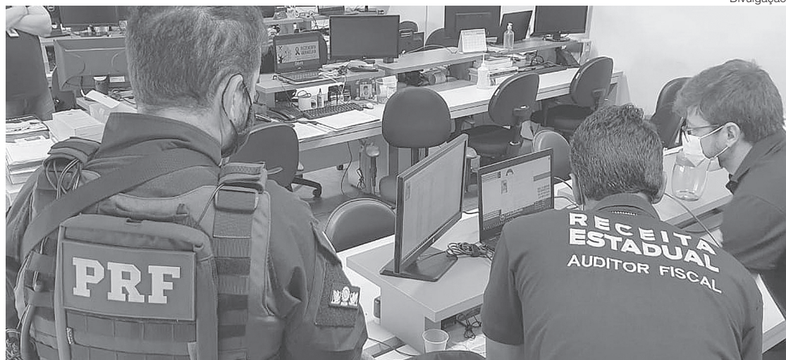
Objetivo é promover intercâmbio de dados, tecnologia e capacitação