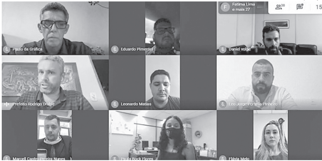
Sessão de diplomação foi virtual, por causa da Covid-19

Drable ainda fez um importante agradecimento a todos profissionais que atuam no serviço público. “Deixo aqui registrado o meu agradecimento que vai do servidor mais simplório aos profissionais que atuam na linha de frente contra o novo coronavírus. O trabalho em equipe que todos desempenharam foi reconhecido nas urnas e não poderia deixar de demonstrar a minha gratidão”, completou o prefeito.