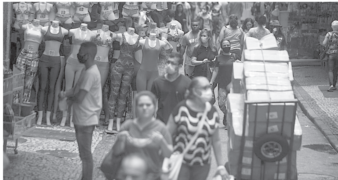
Faturamento de lojas pode subir 3,4%, diz a CNC

A desvalorização do Real é encarada como a principal razão para a queda de 16,5% nas importações de produtos tipicamente natalinos no trimestre encerrado em novembro, na comparação com os mesmos meses de 2019. A única categoria de produto que não teve queda de importação foi a de bebidas.