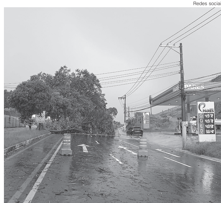
Alagamento foi registrado na Vila Santa Cecília, próximo ao Mercado Popular