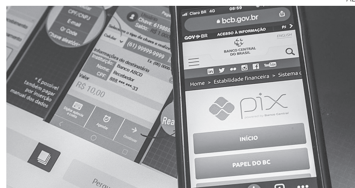
Até o momento, foram registradas 46 milhões de pessoas que já utilizam o Pix

O Pix é gratuito para pessoas físicas. A cobrança de tarifa para transações feitas por pessoas jurídicas é permitida pelo BC, mas, nesse período inicial, ainda não começou a ser feita pelas instituições financeiras.