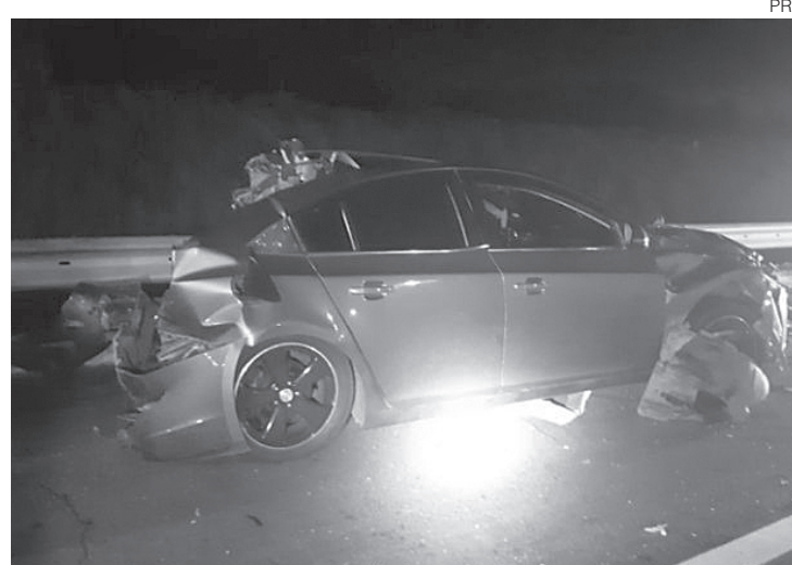
Vítimas foram socorridas e levadas para o Hospital de Emergência de Resende

Segundo a PRF, o motorista do Cruze foi preso por lesão corporal culposa, agravada pelo fato de não possuir Carteira Nacional de Habilitação e estar dirigindo sob influência de álcool. "Durante o atendimento do acidente e verificação de documentação