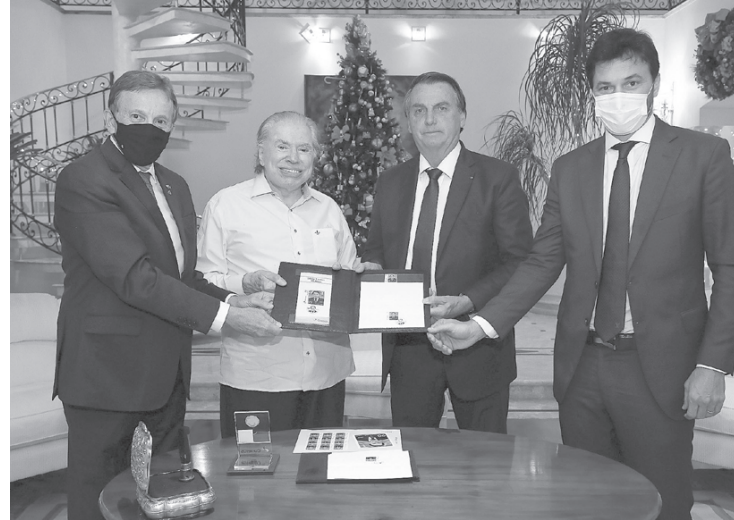
Selos estão disponíveis nas agências e loja virtual dos Correios

Bolsonaro retribuiu os elogios: “O senhor tem um carisma que ninguém consegue entender. É uma realidade, está no sangue, na sua