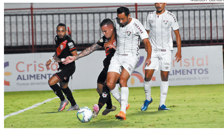
Fluminense errou muitos passes, criou poucas chances de gol e foi pouco competitivo